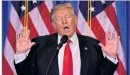
VOTO A LA DIVINA LA PRIMERA MUJER DE ESPAÑA. Con el voto de Donald Trump se abre un capítulo decisivo en la historia de la política estadounidense.

El presidente electo admite que Rusia puede estar tras los chernóbilas a su favor.