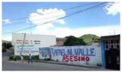
Una periodista acusa al gobernador de Puebla de la muerte de un menor